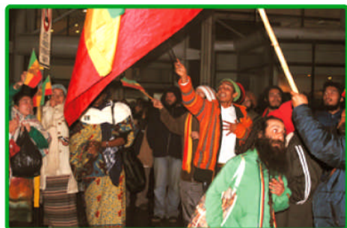
Bienvenida en el Aeropuerto Internacional de Santiago, el día 2 de mayo, a las 04:00 hrs. de la madrugada.