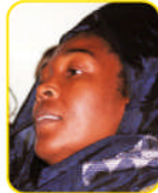
Empress Esther, Actual Lider de la Liga de Emperatrices de Orden Bobo Ashanti