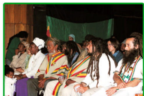
Exposición Internacional de Cultura Rastafari, Centro Cultural Alameda el día miércoles 4 de mayo de 2006.