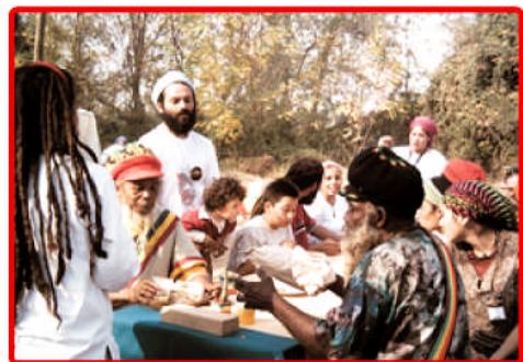
Visita del Campamento Rastafari en Pirque, por los Honorables Sacerdotes y Emperatrices.