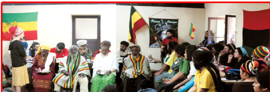
Campamento Rastafari en Til-Til, las actividades de la Visita Real continuaron y finalizaron en este lugar.