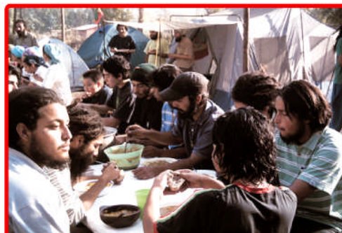
Campamento Rastafari en Pirque, durante la Visita Real, unificó a Hermanos desde Arica hasta Punta Arenas.