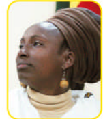
Empress Iffiya, Actual Vice Presidente de Orden Nyahbinghi

“Alabad a JAH, porque Él es bueno; porque para siempre es su misericordia. Díganlo los redimidos de JAH, los que ha redimido del poder del enemigo Y los ha congregado de las tierras del oriente y del occidente, del norte y del sur.” (Salmo 107: 1-3)