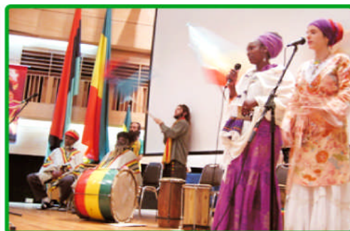
Exposición Internacional de Cultura Rastafari, Aula Magna UPLA, Valparaíso, 8 de mayo de 2006.