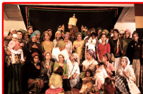
Recibimiento en el Salón Municipal de Pirque