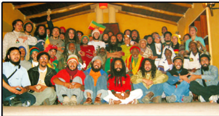
San Juan de Pirque, lugar donde se vivieron unos de los momentos más hermosos de la Visita Real.