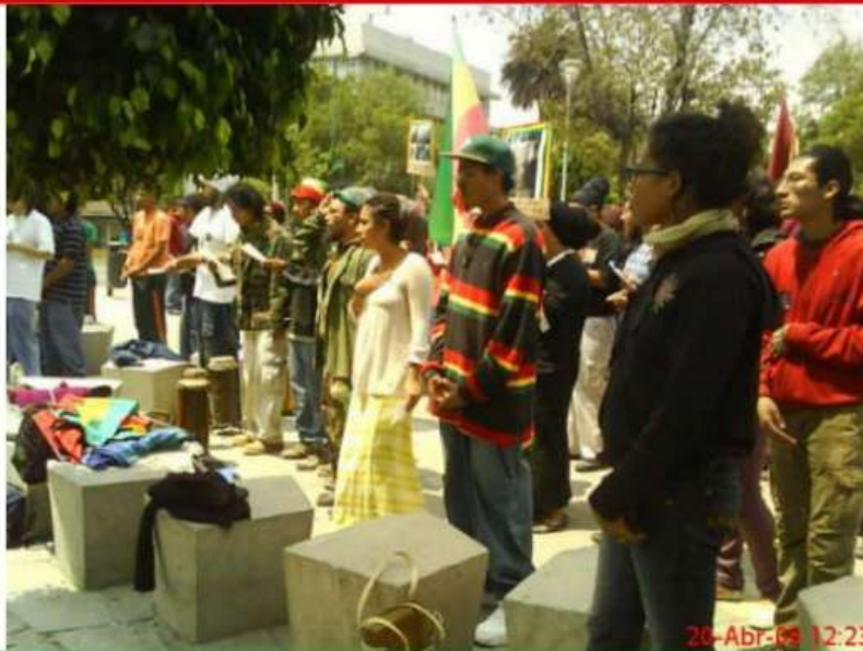
Yo y Yo mira al ESTE a la tierra de los padres de I&I