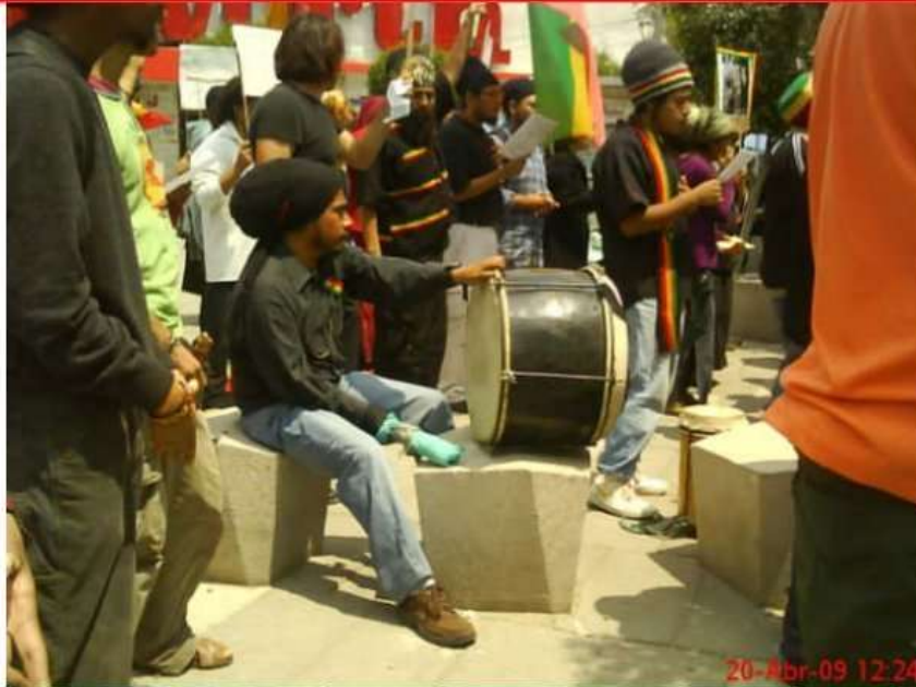
La Congregacion Yo y Yo México y El Taller Nyahbinghi México entonando el Himno Etiope.