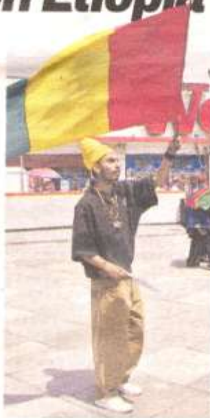
Rastafaris se manifestaron contra el cambio de nombre de la estación.

El 19 de julio de 1954, Haile Selassie I, emperador de Etiopía, visitó México durante siete días, fue recibido por el entonces Presidente, Adolfo Ruiz Cortines; entre sus actividades, develó un placa conmemorativa en la Plaza Etiopía, por la cual posteriormente se le dio el nombre a esa estación de la Línea 3 del Metro, recordaron.