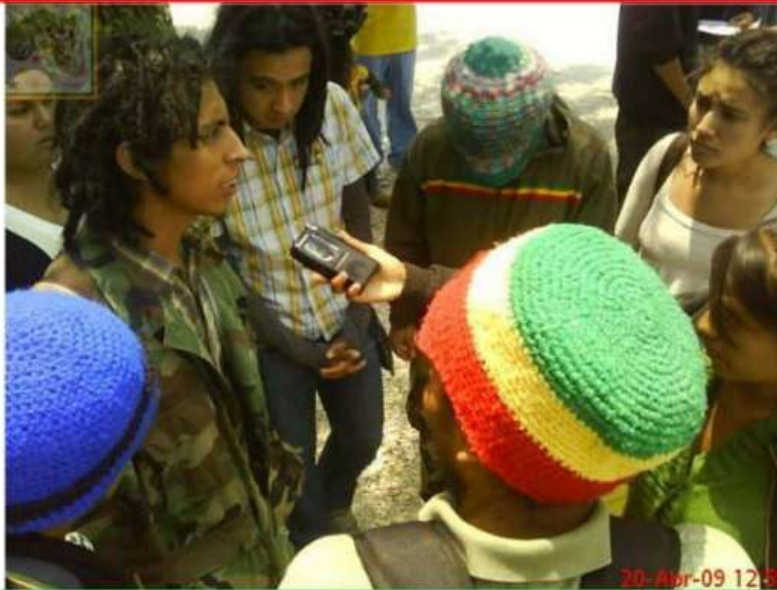
Radio Hip-hop entrevistando a Taller Nyahbinghi